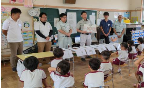
イラストを使った肥料の説明