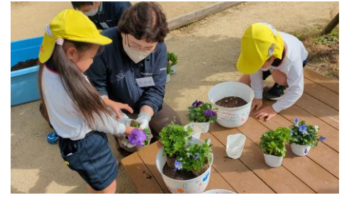
植物を育てる大切さや喜びを実感