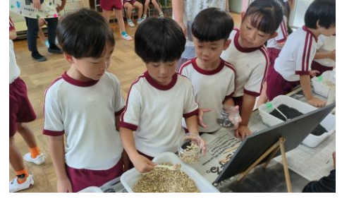
こども自身の手で肥料を配合する