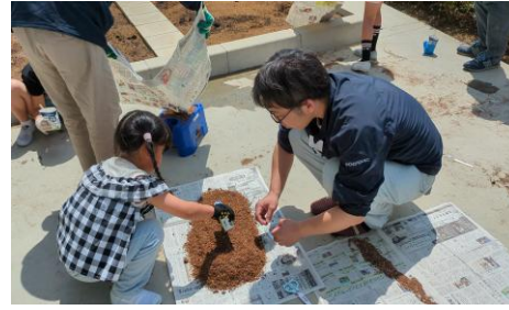
作った肥料を社員と一緒に撒く