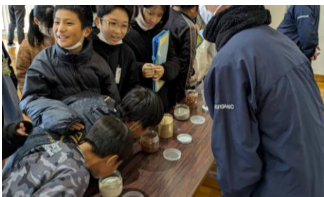
肥料の原料のにおいを感じる