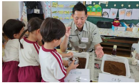
どんな肥料を作るか自分で考える