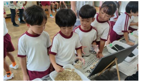
子ども自身の手で肥料を配合する