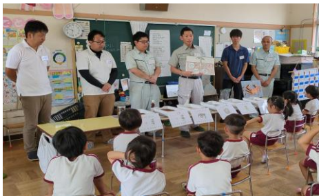
イラストを使った肥料の説明