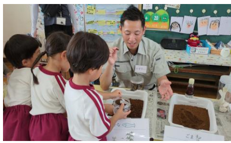
どんな肥料を作るか自分で考える